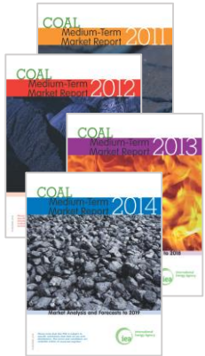
(a) ewi-Mitarbeit an den IEA Medium-Term Coal Market Reports der Jahre 2011-14 (links); Erwartetes Wachstum der Kohlenachfrage 2013-19 (rechts)